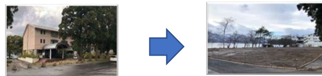
廃屋撤去による景観改善

アドベンチャートラベルの展開に向けた地域資源の洗い出し、連携枠組みの構築、体験の磨き上げ等