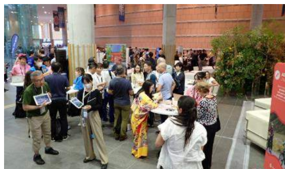
会場内のネットワーキングの様子 (Japan Lounge付近)