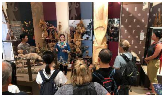
Day of Adventureの様子