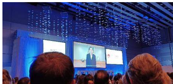
オープニングセレモニーでの斉藤大臣のビデオメッセージ放映