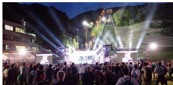
大倉山ジャンプ競技場でのウェルカムレセプション

※ATWS北海道実行委員会構成員：北海道、札幌市、釧路市、北海道観光振興機構、北海道経済産業局、北海道運輸局 ほか（経済団体、交通事業者、旅行業団体等）